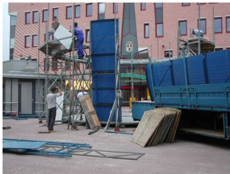
Steile wand opbouw Etten-Leur, 2005.