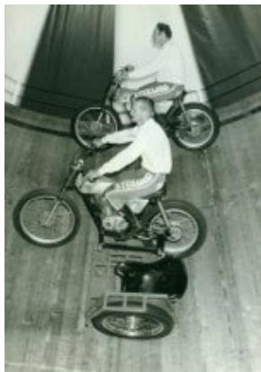
L. Dusomos boven in beeld: foto Vintage wall of death.